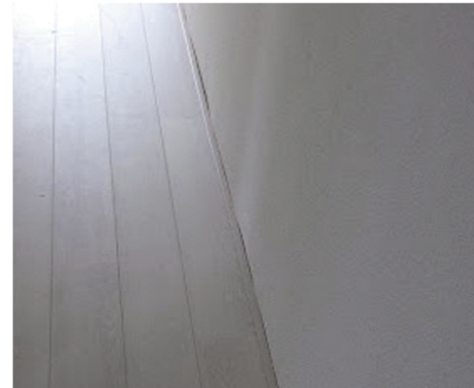
Glooiing van de wand