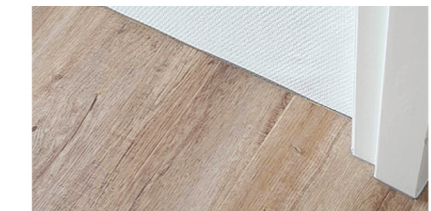
PVC vloer zonder plint, gekit met siliconenkit trijs