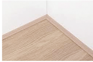
Platte- of plak-plint