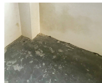
Stuc en verfresten op vloer