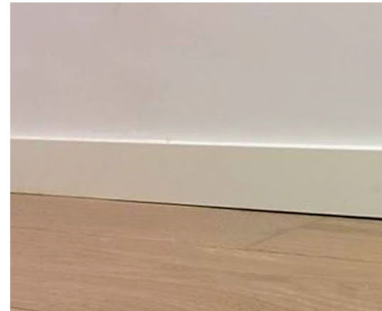
Glooiing in een PVC vloer

Vaak zijn veel problemen die voorkomen bij de randafwerking het gevolg van slechte voorbereidingen in de woning. De vloerenlegger komt bijvoorbeeld in een woning waar: de stucresten nog op de vloer zitten, de stukadoor de wand niet correct heeft afgewerkt op de basisvloer, bij het storten van de vloer glooiingen in de basisvloer zijn ontstaan of veel verflagen over elkaar zijn aangebracht bij plinten en kozijnen waardoor niets strak of glad is