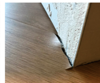
Wand niet goed afgewerkt