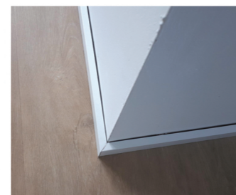
Wand is hol